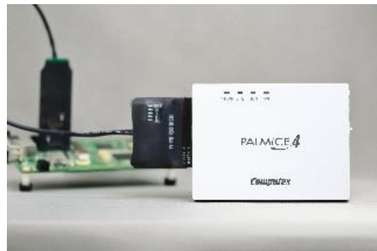
大容量トレースモデル