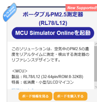
図 1 MCU Simulator Online のサンプルプロジェクトの選択画面