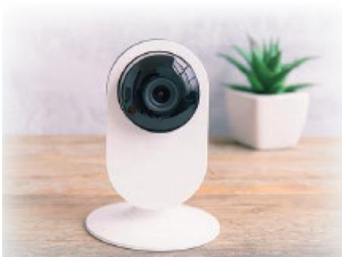
ホームセキュリティ