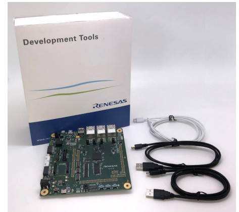
Renesas Starter Kit+ for RZ/N2L (P/N:RTK9RZN2LOS00000BE)