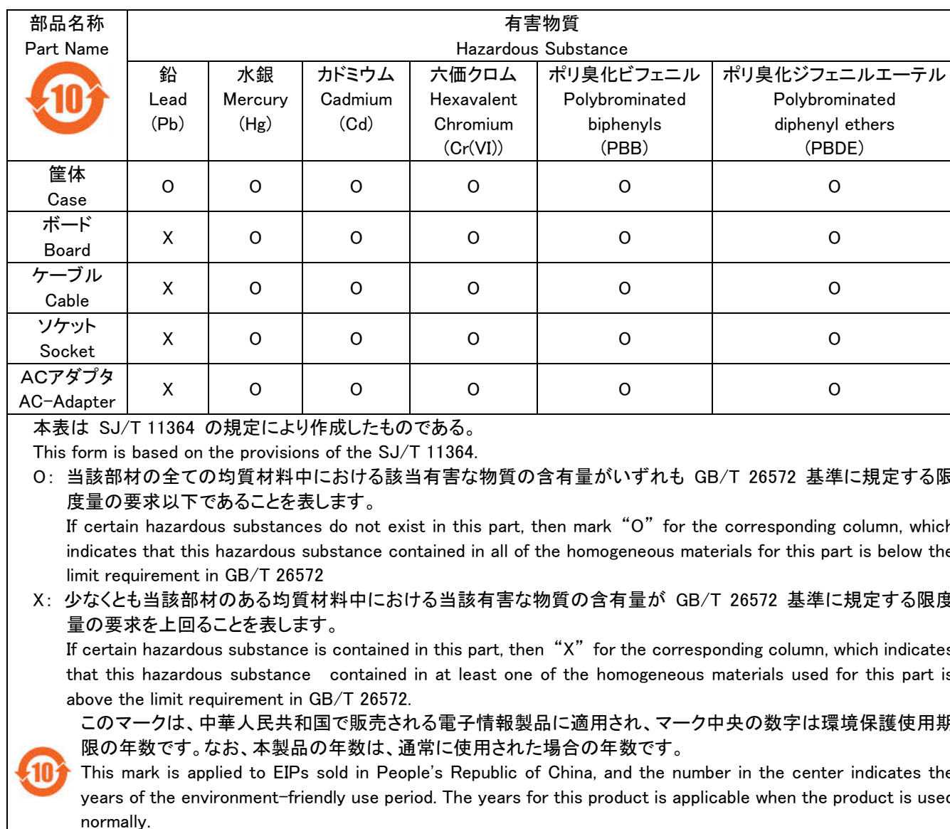
Table of Hazardous Substance

注) この表には電子情報製品全ての添付品を記載しており、製品によっては同梱されていないものがございますのでご了承ください。