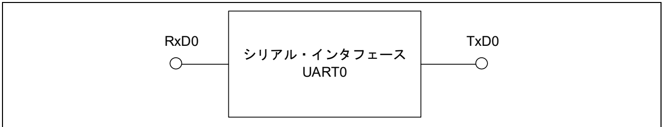
図 1.1 シリアル・インタフェース UART0 のブロック図

78K0/Kx2 に搭載しているシリアル・インタフェース UART0 は、データ送受信の入出力端子を 1 チャンネル搭載しています。図 1.1 にシリアル・インタフェース UART0 のブロック図を示します。