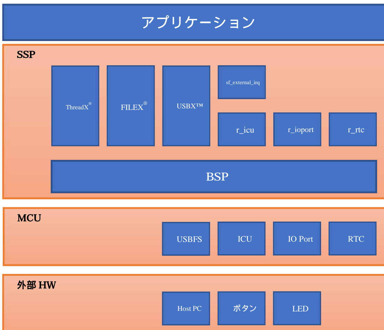
図 2:モジュール構成