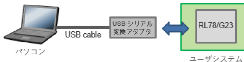
図 2 RL78 COM Port

デバッグ・ツールに RL78 COM Port を追加しました。USB シリアル変換アダプタを使用して安価にプログラムをデバッグすることができます。