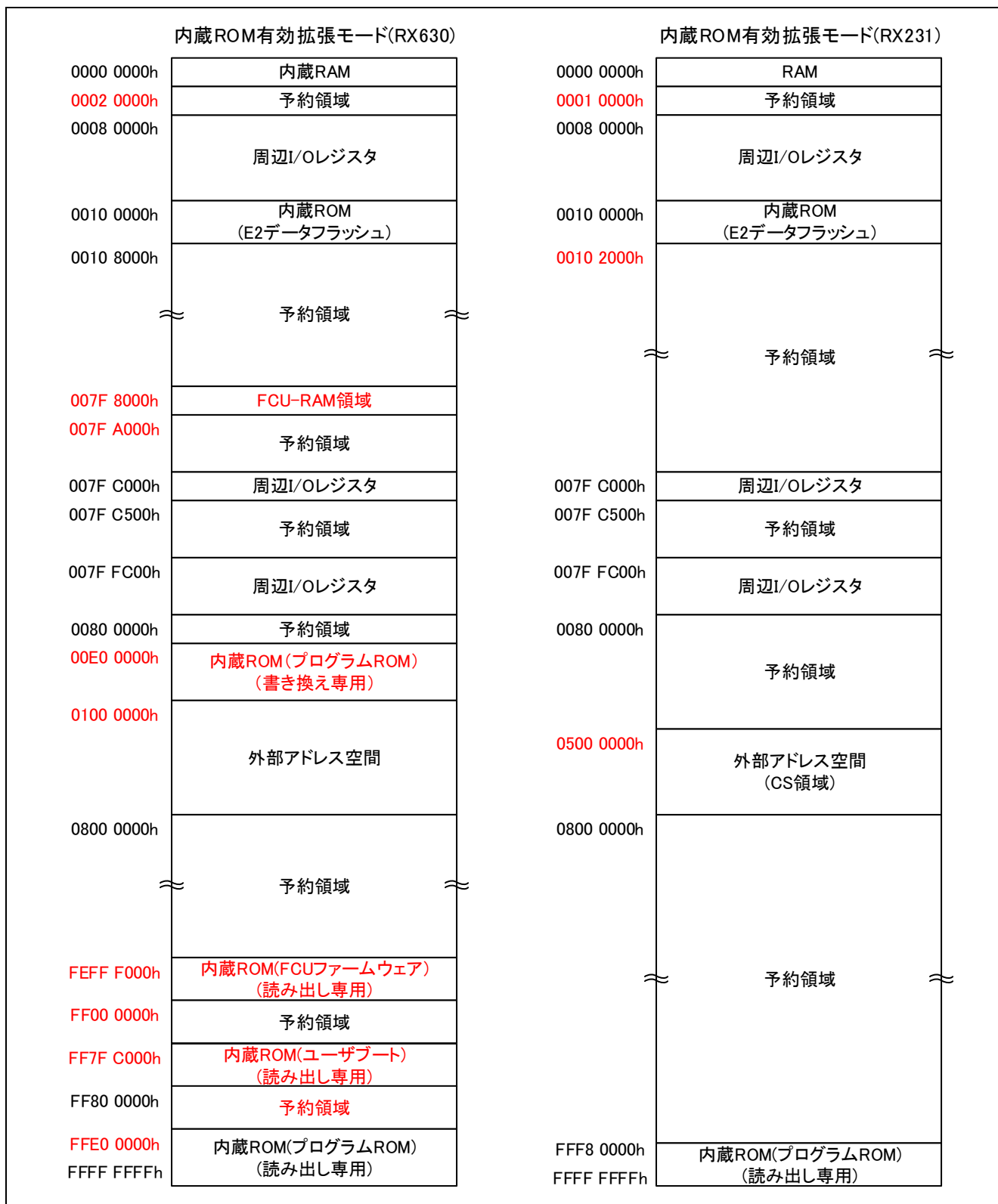
図2.2 メモリマップ比較 (内蔵ROM有効拡張モード)