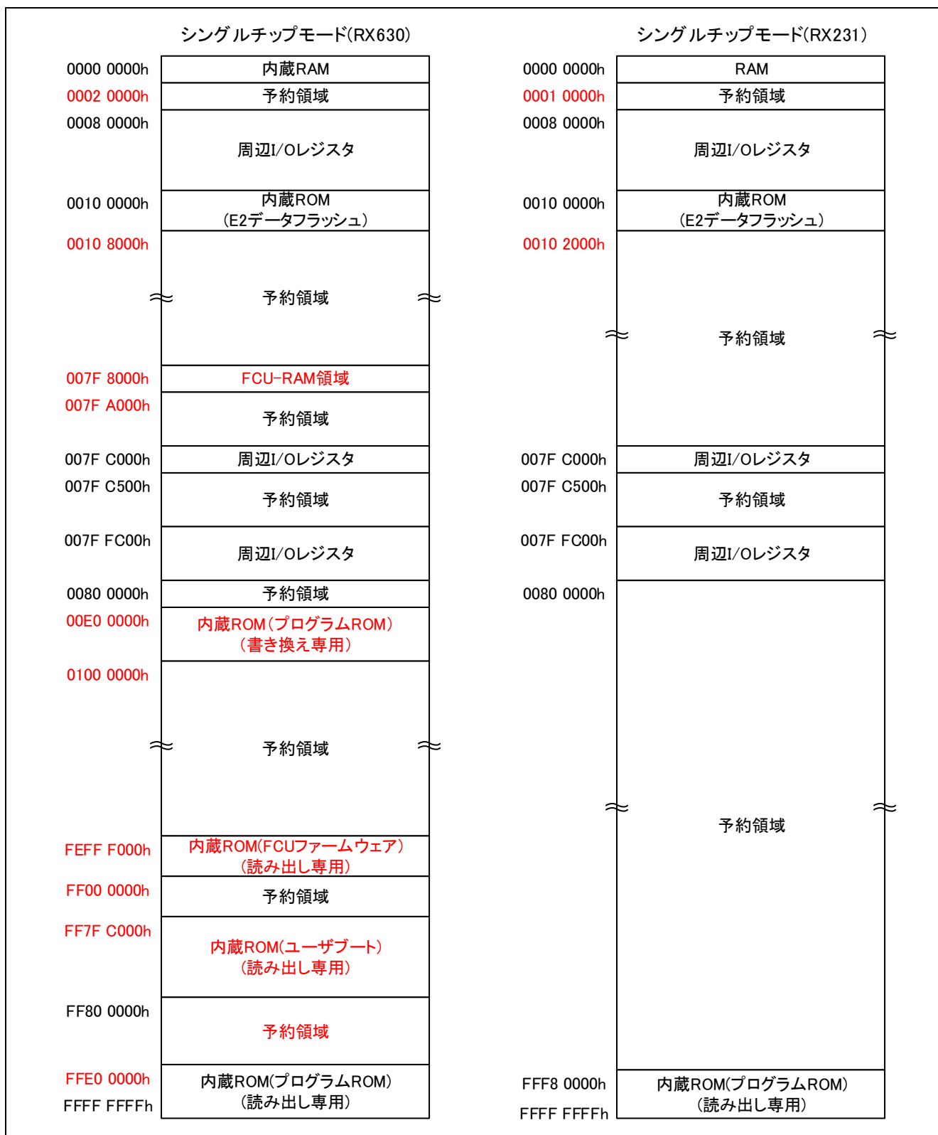
図2.1 メモリマップ比較 (シングルチップモード)