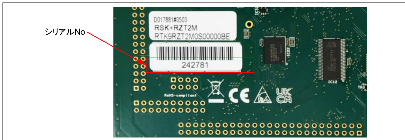
図 1 シリアル No 貼付位置(CPU ボード半田面)