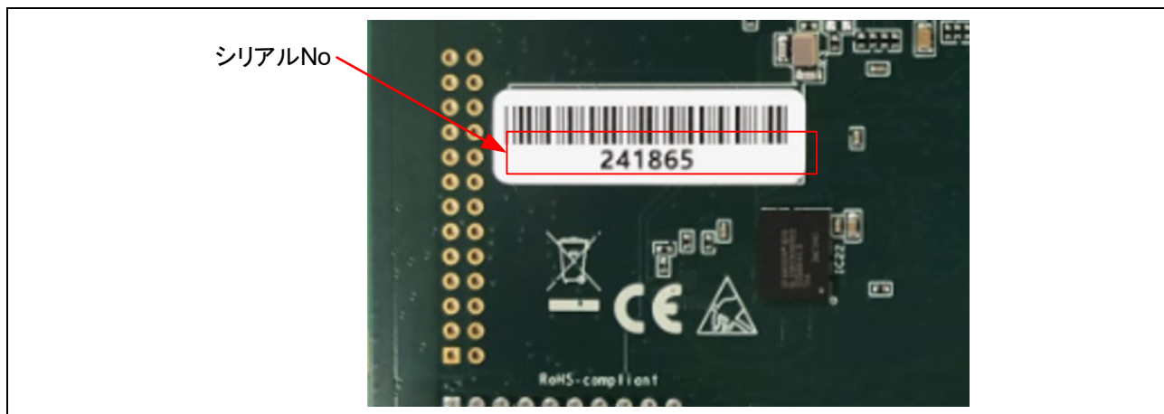
図 1 シリアル No 貼付位置(CPU ボード半田面)