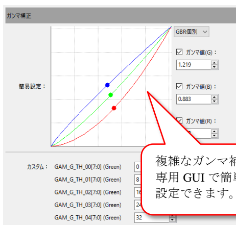
図 2 : ガンマ補正調整画面