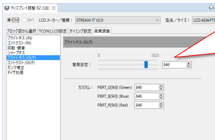
図 1 : 画質調整画面(ブライトネス (OUT))

VDC5 の持つ画質調整機能に新たに対応しました。ブライトネス、コントラスト、回転・鏡像、シャープネス、ガンマ補正、ディザ処理の調整を簡単に行うことができ、開発初期の開発期間短縮に貢献します。それぞれの機能の画面例については、下記をご参照ください。