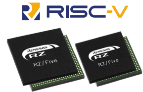
361pin LFBGA 266pin LFBGA

RZ/Fiveマイクロプロセッサ (MPU)は64ビットRISC-V ISA*準拠のCPU (AX45MP Single) 1.0 GHz、16ビットDDR3L/DDR4 インタフェースを内蔵しています。また、Gbit-Ethernet、CAN、及び、USB 2.0などの多くのインタフェースも備えており、エントリークラスの社会インフラ用途ゲートウェイ制御機器や産業用途ゲートウェイ制御機器などのアプリケーションに最適です。RZ/Five MPUはArmとRISC-V間の相互移行をサポートすることで、開発を拡張できます。