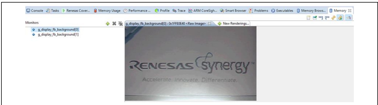
図 2 PDC アプリケーションプロジェクトからのサンプル出力