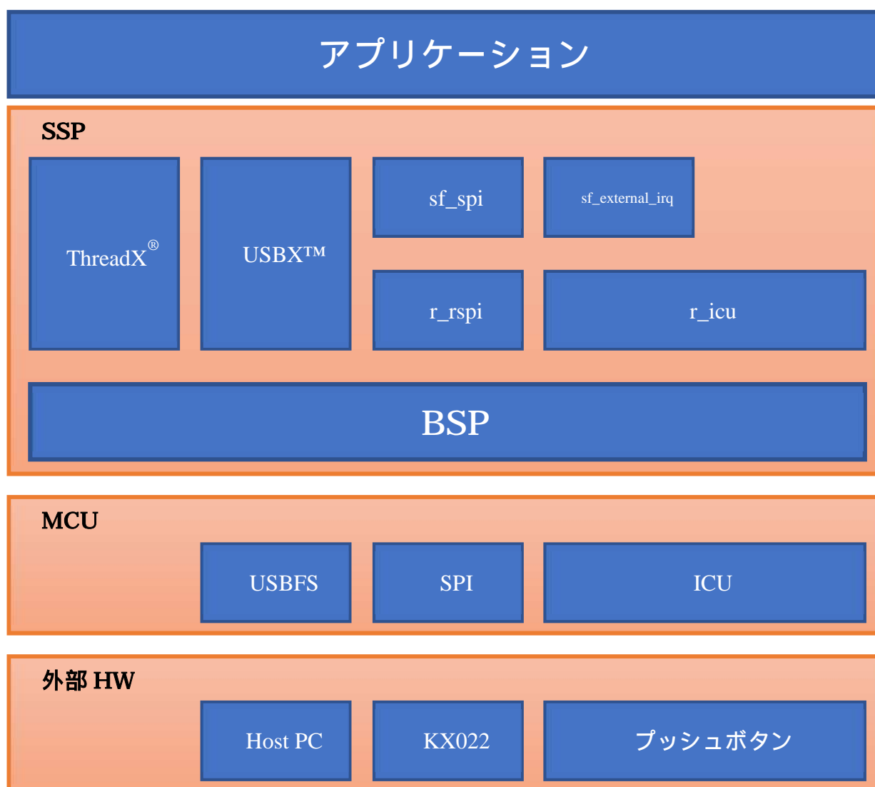
図 2:モジュール構成