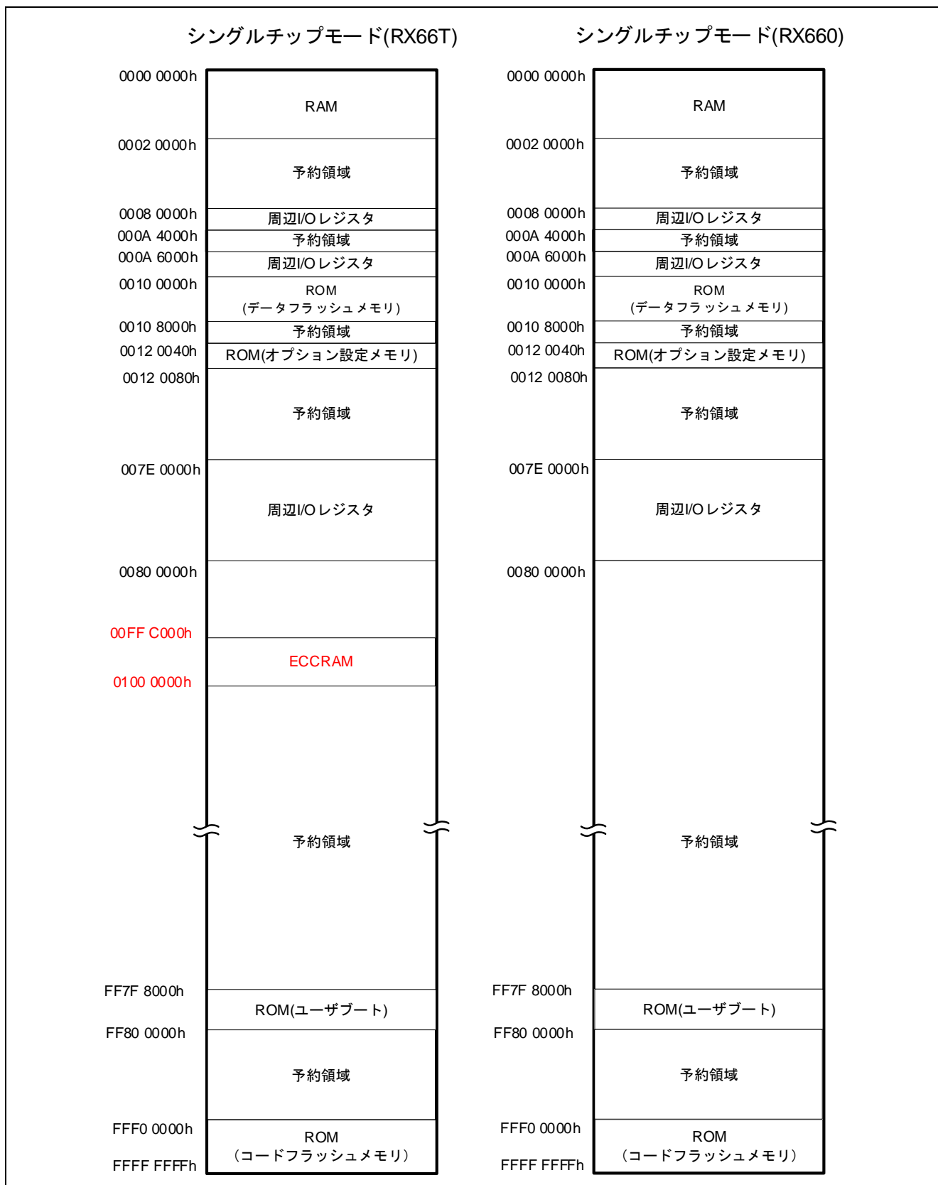
図 2.1 シングルチップモードのメモリマップ比較