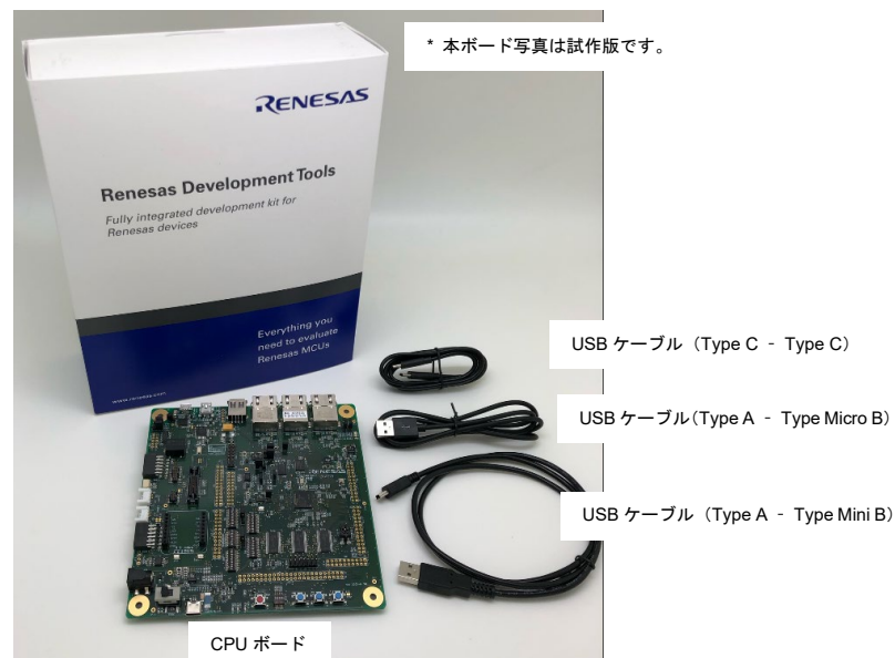
図 1 Renesas Starter Kit+ for RZ/T2L