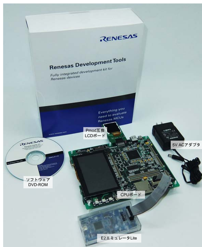
図 1 Renesas Starter Kit+ for RX65N-2MB

開発に必要な以下のハードウェアとソフトウェアがすべて同梱されていますので、開封後すぐに RX65N の評価が可能です。