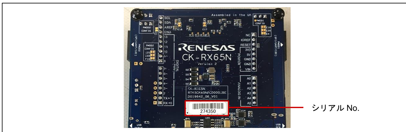
図 3 シリアル No.の表示位置 (CK-RX65N v2 ボード 裏面)