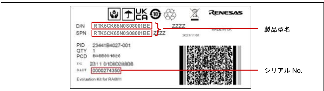
図 2 製品型名とシリアル No.の表示位置 (製品個装箱 側面)