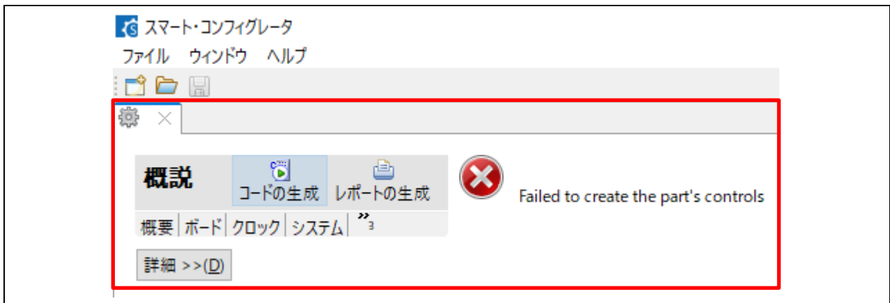
図.1 プロジェクトを再度開いたときのエラー

スマート・コンフィグレータのプロジェクトを再度開くときに、エラーが発生する場合があります。