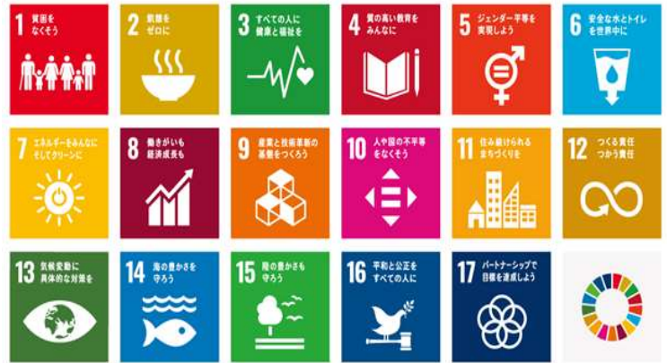
SDGs 17 のゴール