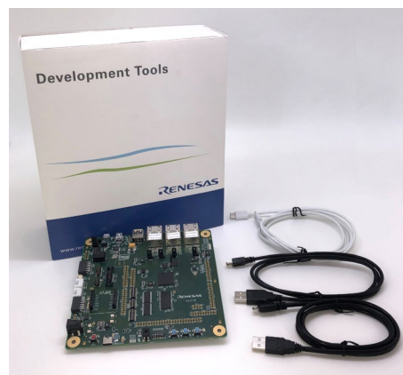
Renesas Starter Kit+ for RZ/N2L (P/N:RTK9RZN2LOS00000BE)