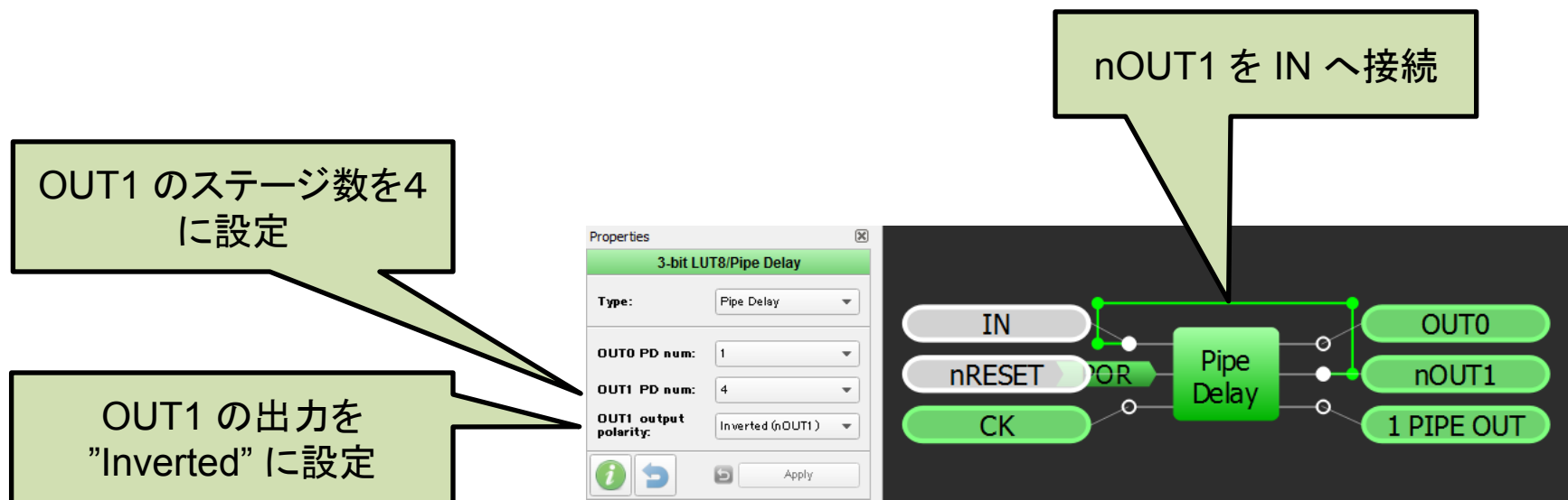
クロック・ディバイダの例(8分周)