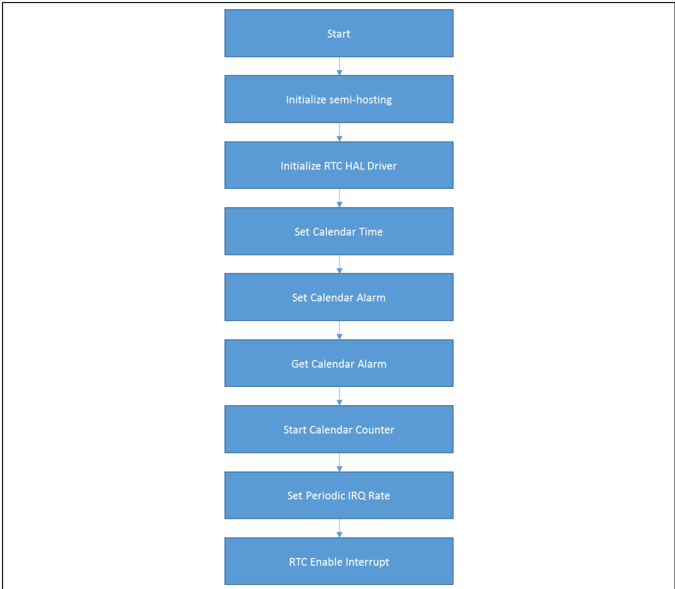
図5 RTCアプリケーションプロジェクトのフロー

rtc_hal_mg.c/.h ファイルは、このプロジェクトを ISDE にインポートすることにより、プロジェクト内に配置されます。ISDE でこのファイルを開き、API の使い方のガイドを受けることができます。