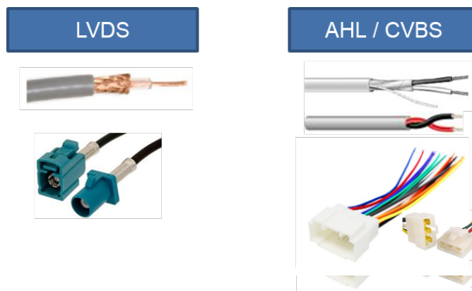
图 2：电缆和连接器示例