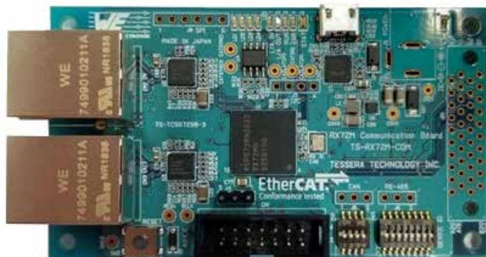
TESSERA TECHNOLOGY INC.