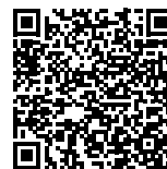
RX72M 産業ネットワークソリューション