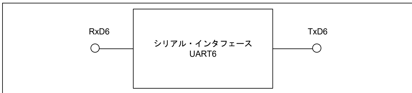
図 1.1 シリアル・インタフェース UART6 のブロック図

78K0/Kx2 に搭載しているシリアル・インタフェース UART6 は、データ送受信の入出力端子を 1 チャンネル搭載しています。図 1.1 にシリアル・インタフェース UART6 のブロック図を示します。