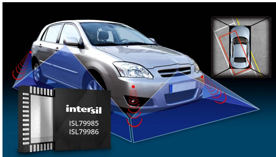
图 3. ISL7998x 4 通道视频解码器可提供超清图像，以提高驾驶员/行人安全

全景环视监控系统可以处理来自四个摄像头的视频，然后将四幅图像合成为一个鸟瞰俯视图，好比摄像头安装在汽车正上方一样。全景监控系统可以帮助驾驶员从视觉上确定汽车相对周围物体的位置，从而方便挪车和泊车。据 Infinity Research 研究，从现在到 2018 年，全景环视监控应用的年复合增长率将达 33%。